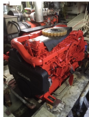
neuer Motor Backbord