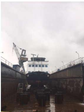
MS Princess im Dock